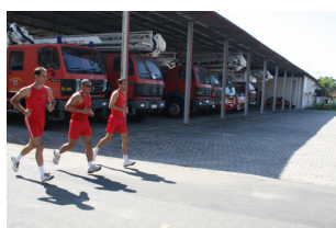
Execução do exercício

5.1 Corrida de 12 minutos: consiste num exercício para o qual o militar efetuará um deslocamento contínuo, podendo andar ou correr, onde a distância percorrida será convertida em pontos de acordo com a tabela.